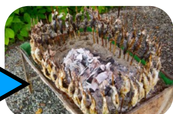
取ったお魚は食べられます