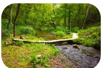
水辺の探検エリア：無料