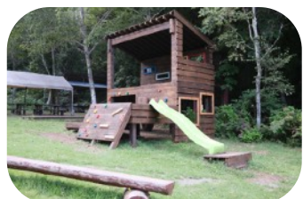
アスレチック：無料