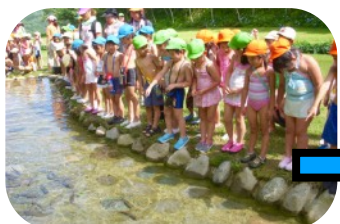
魚のつかみ取り：800円